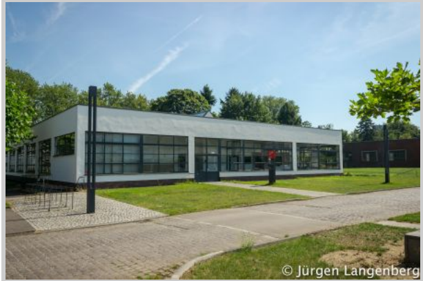
Schlichterei der Verseidag