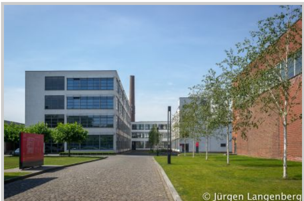
HE-Gebäude der Verseidag