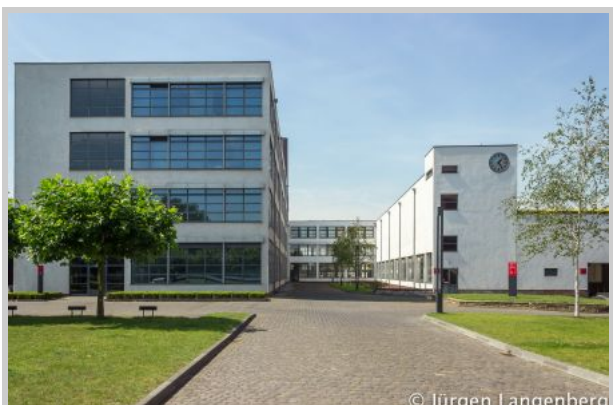
HE-Gebäude der Verseidag

Hier befinden sich die einzelnen Objekte: