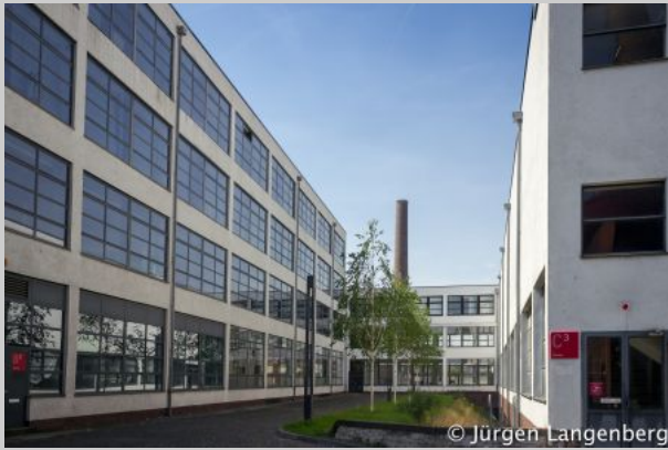
HE-Gebäude der Verseidag