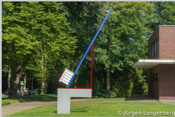
Skulptur vor dem Haus Lange

Hier einige Impressionen seiner Werke in Krefeld: