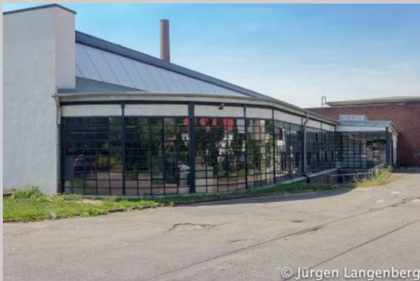
Pförtnerhaus der Verseidag